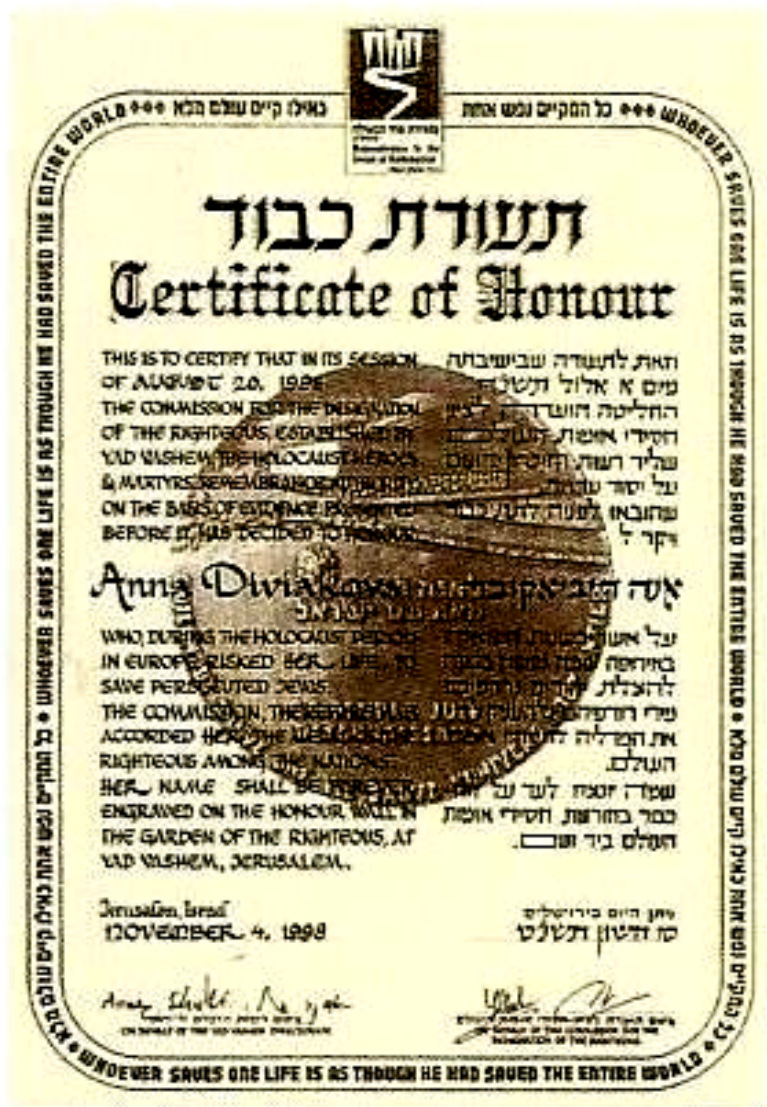
Detail: Diplom Spravodlivých medzi národmi pre Annu Diviakovú.